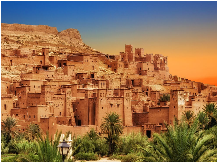
Blick auf Ait Ben Haddou

Ein spannendes Wüstenabenteuer in atemberaubender Landschaft wartet auf dich. Du lässt dich auf die Stille und Weite der Sahara ein, wanderst mit Dromedaren zu den phantastischen Sanddünen und schläfst im Zelt unter dem funkelnden Sternenhimmel. Davor und danach lernst du das exotische Marrakesch sowie historische Kasbahs wie Ait Ben Haddou kennen.